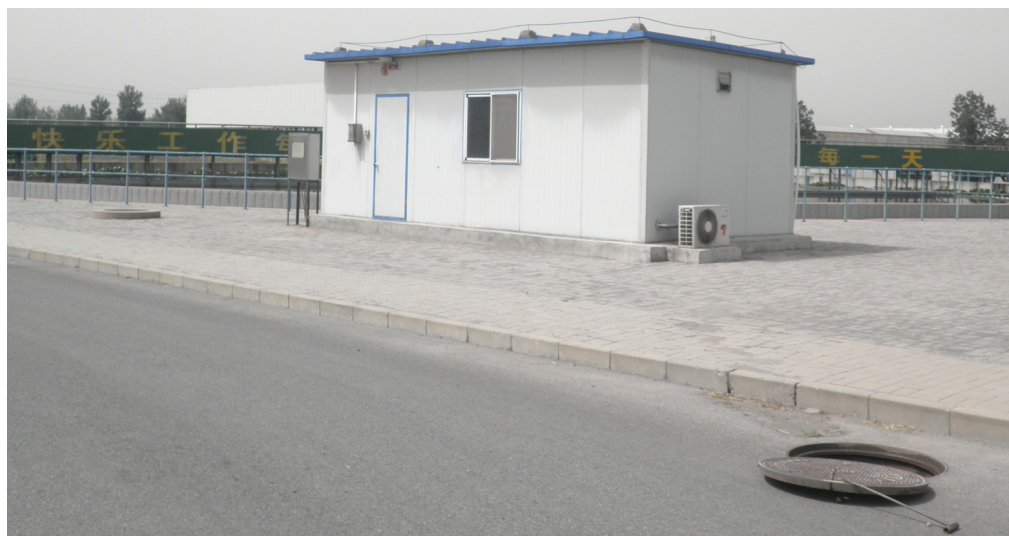
图 2 监测采样口 1 近景照片