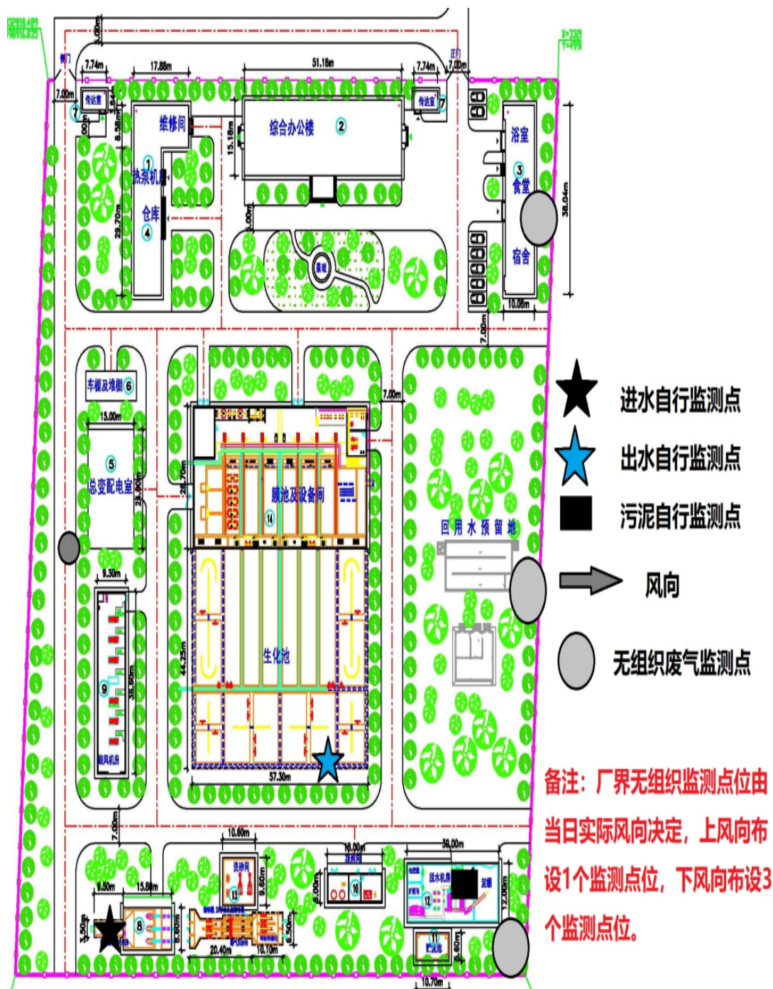
图3 监测点位示意图