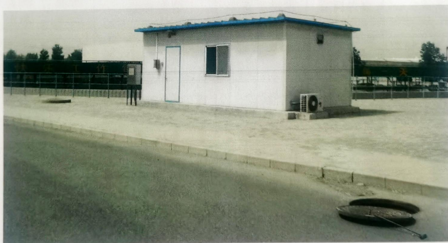
图 2 监测采样口 1 近景照片