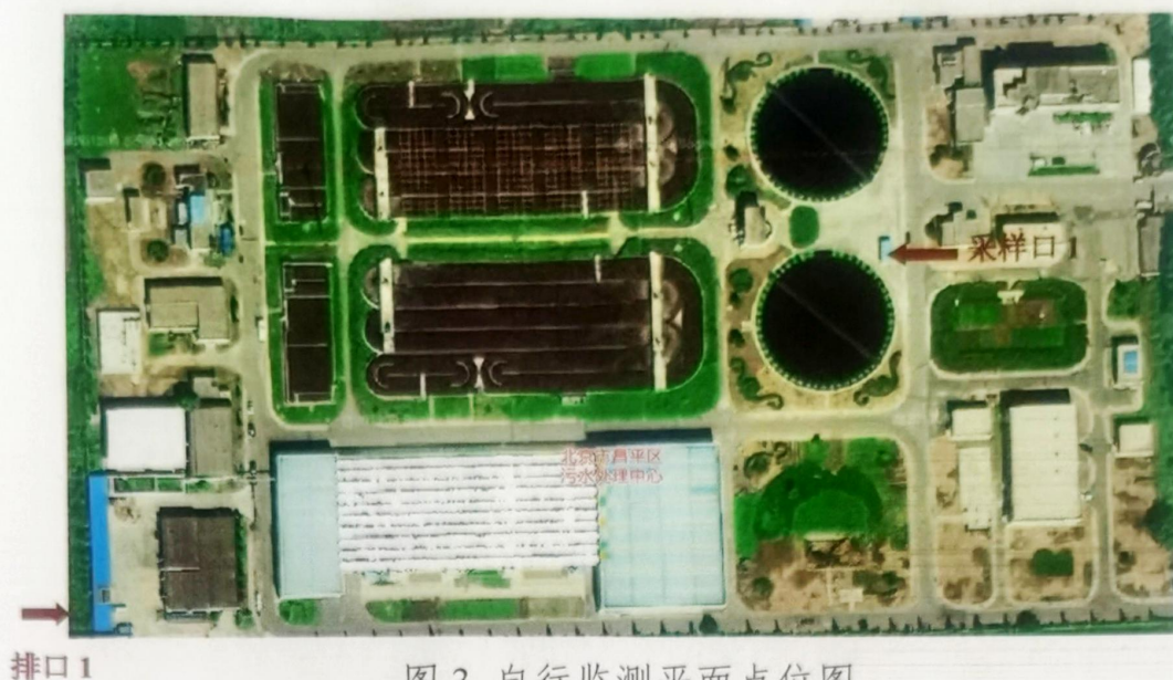
图 3 自行监测平面点位图