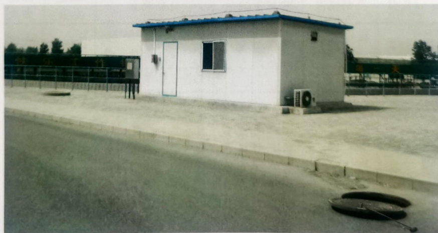
图 2 监测采样口 1 近景照片