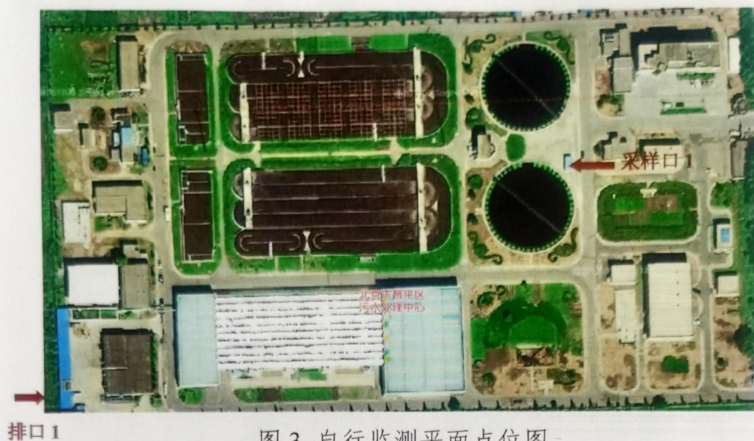
图 3 自行监测平面点位图