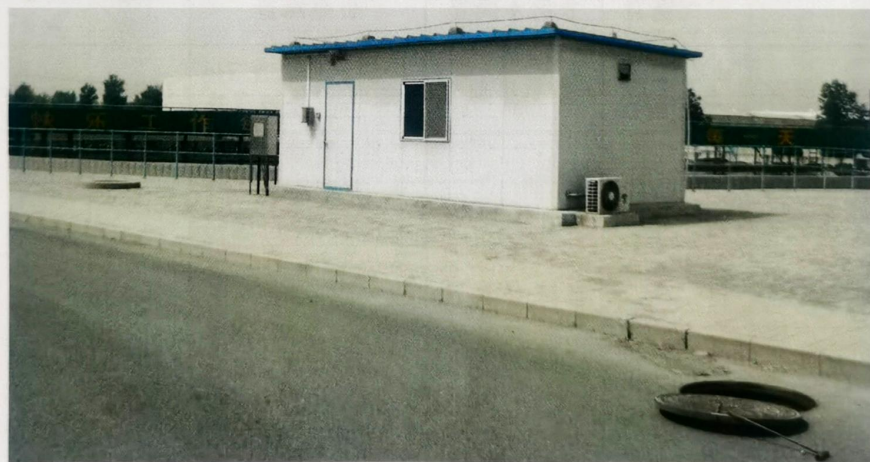
图 2 监测采样口 1 近景照片