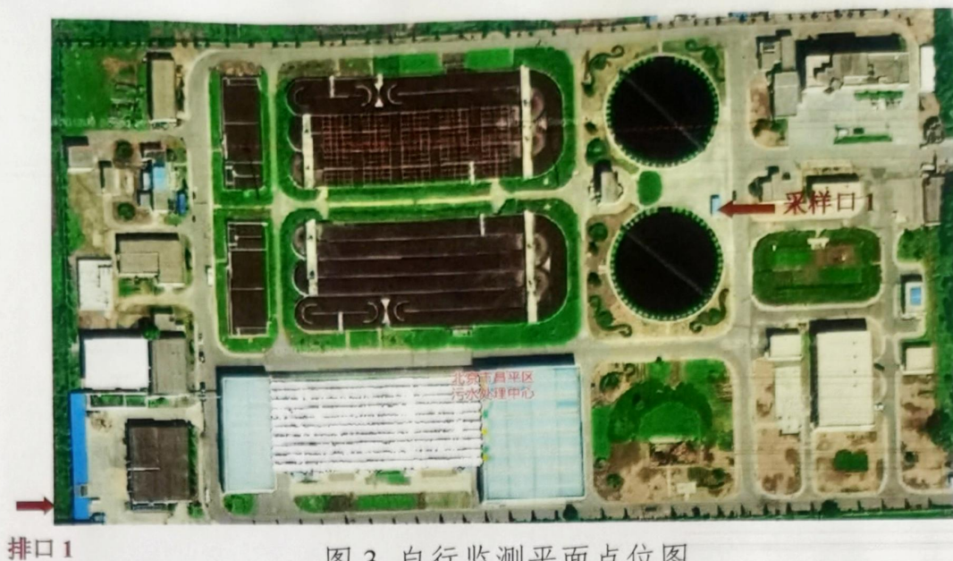
图 3 自行监测平面点位图