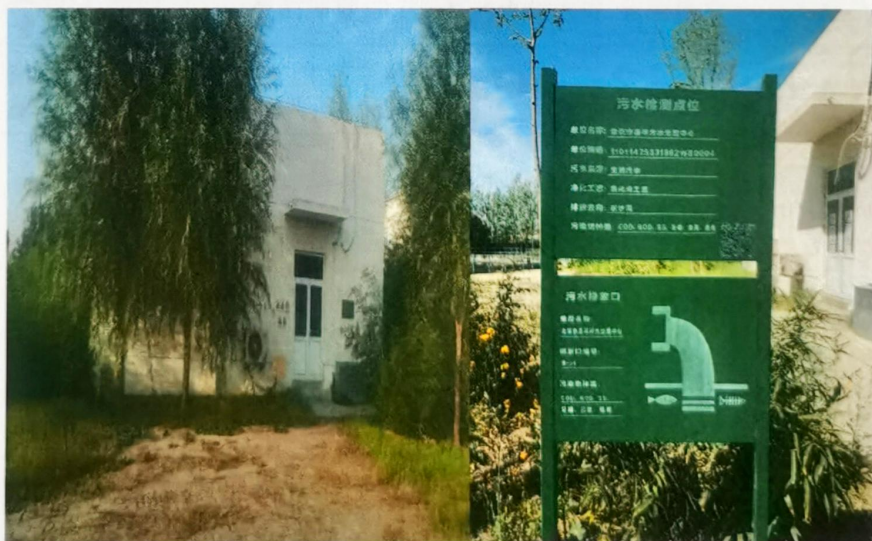
图 2 监测采样口 1 近景照片