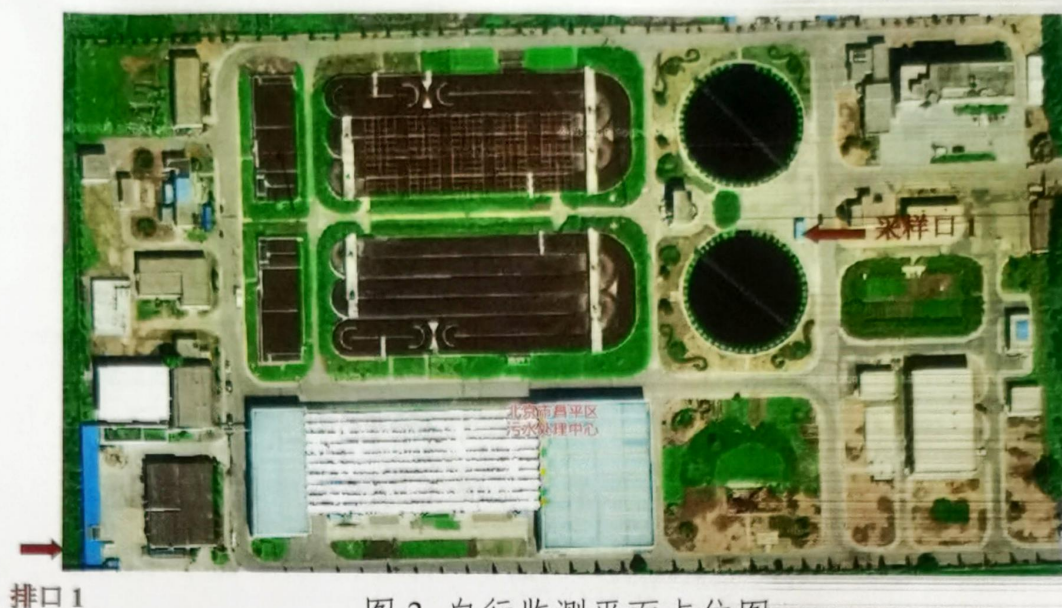
图 3 自行监测平面点位图